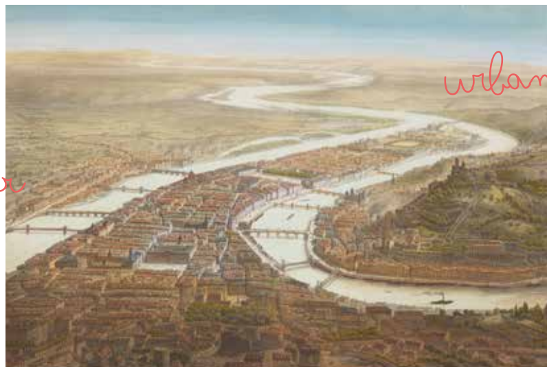
Lyon, vue prise de la Croix-Rousse (reproduction), 1850, A. Guesdon.