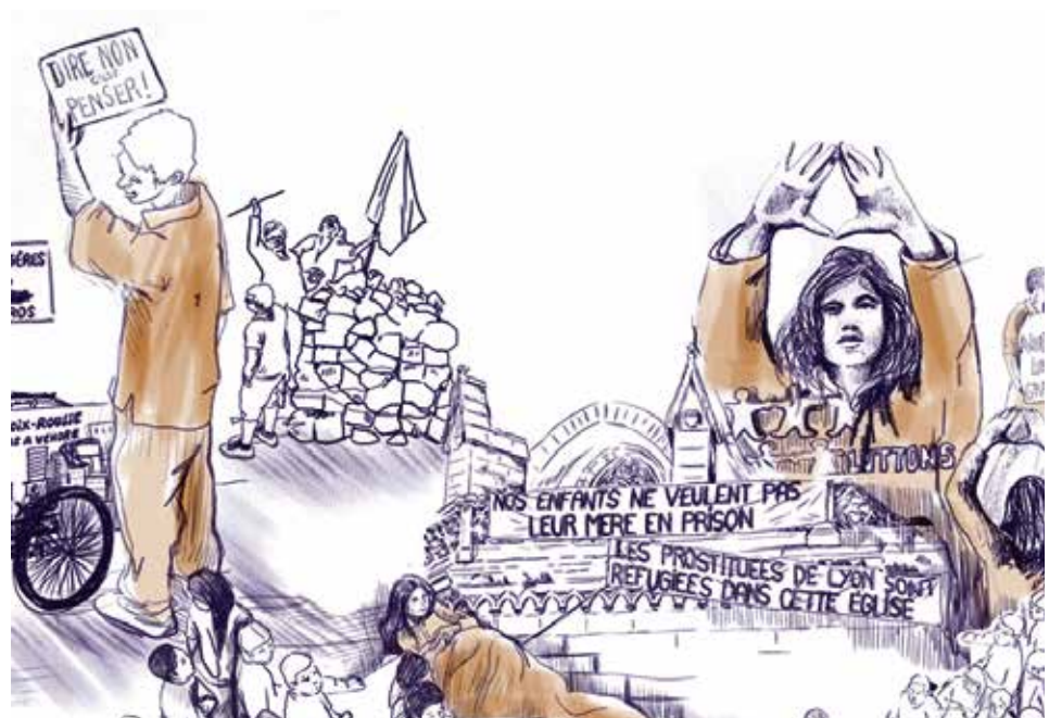
Étape de travail d'Olivia Paroldi dans la réalisation de la fresque pour le MHL - Gadagne : gravure des plaques.