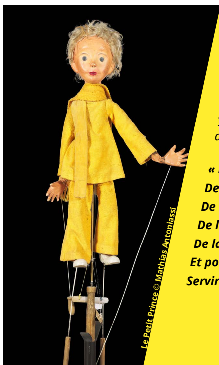
Le Petit Prince © Mathias Antonjassi