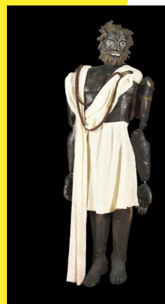
Créon, Antigone © Mathias Antoniassi

Don Quichotte (1988) - Miguel de Cervantès 2 marionnettes.