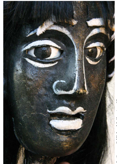
Antigone © Michael A. Kersten, Visages

Chacune de ces pièces recèle une somme d'inventivité et de création remarquable. Les choix techniques sont au service de la force de l'œuvre. L'exposition dévoile les secrets de