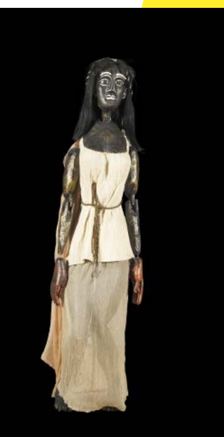
Antigone © Mathias Antoniassi

Pour un artiste, se séparer de ses créations pour les confier à un tiers représente un enjeu très fort qui s'accompagne d'une décision mûrement réfléchie. C'est donc un grand honneur pour le MAM d'accueillir cette donation.