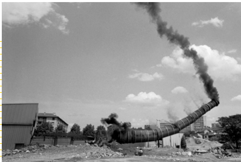
Démolition de la cheminée de l'usine des conserveries de fruits Lenzbourg, à Lyon 8 e , en 1991. L'un des derniers symboles du passé industriel du 8 e arrondissement lyonnais.

Les commandes passées à des photographes permettent d'illustrer l'industrie dans ses formes contemporaines à travers trois grands axes : les territoires, les productions et les travailleur-euses.