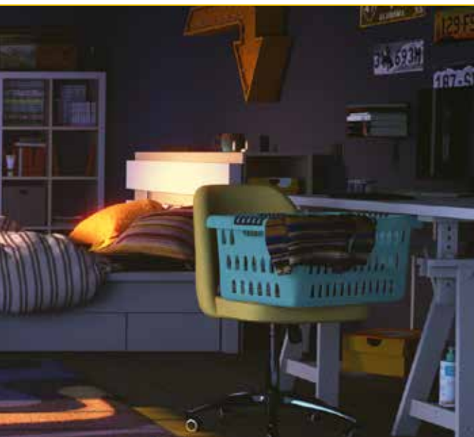
Dessin représentant une chambre d'adolescent·es d'aujourd'hui, avec la présence d'objets manufacturés du quotidien. Image © Vicky Petrequin.