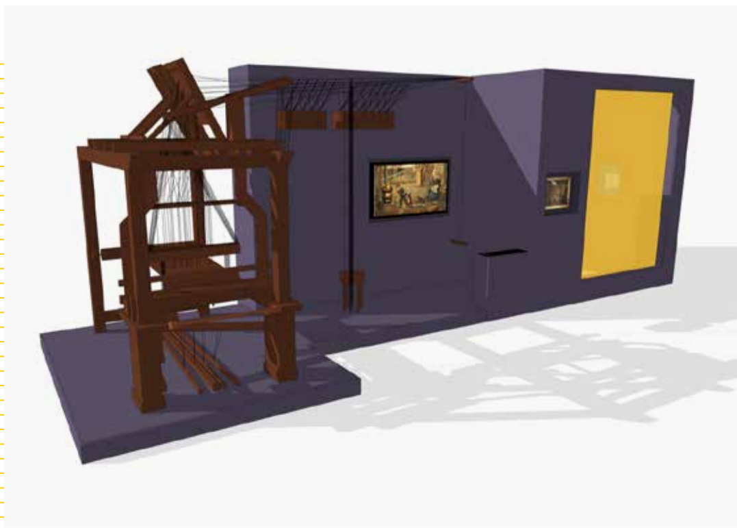
Vue scénographique du métier à tisser à la grande tire. Salle 1 de l'exposition.

Partie 1 - Une vidéo décalée, réalisée par le studio lyonnais Maître Chat , résume la longue histoire des métiers à tisser lyonnais. À partir du célèbre tableau Intérieur d'un atelier de canut de Balthazar Alexis (voir p.5), le film remet dans leur contexte d'utilisation les métiers à tisser, avec les travailleur-euses qui l'entourent, au sein de la grande pièce à vivre et à travailler des canuts.