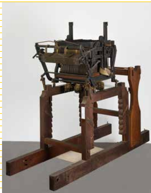
Mécanique Jacquard à division Vincenzi (1906) du constructeur lyonnais Verdol, provenant de l'école municipale de tissage. Collections du Musée d'histoire de Lyon - Gadagne.