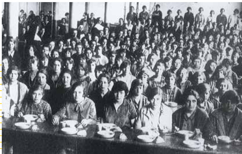
Le réfectoire des Établissements Bonnet à Jujurieux, carte postale, vers 1925, Collection départementale des Musées de l'Ain.

Pratique répandue, mais méconnue, la perruque consiste pour l'ouvrier-e à détourner du temps de travail, des outils ou des matériaux pour fabriquer des objets à son profit.