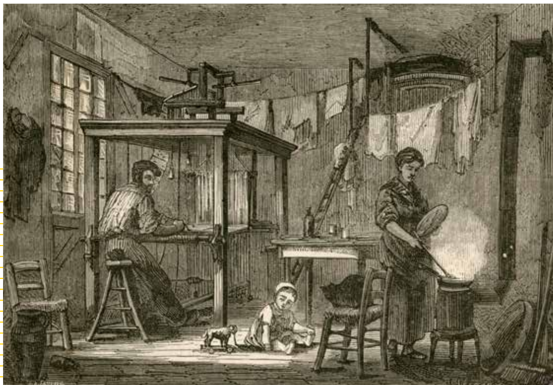
Intérieur d'un tisseur lyonnais. Dessin d'après nature de Gérardin.