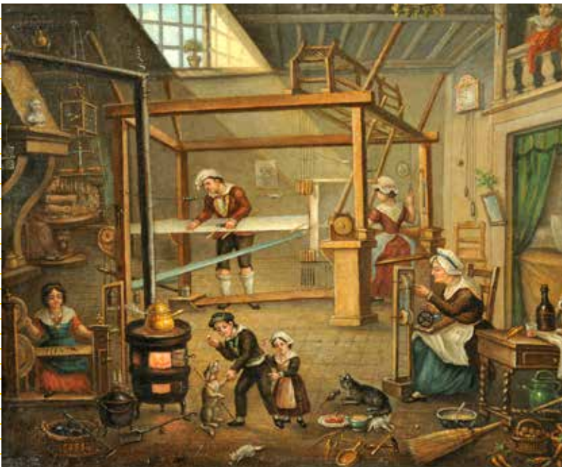
Intérieur d'un atelier de canut. Huile sur carton. Balthazar Alexis. 19 e siècle. Musée d'histoire de Lyon - Gadagne.

Cette exposition, interpellative et « rythmée », est plus particulièrement à destination des adolescent·es (12-15 ans) accompagnés (de leur parents et enseignant·es). Il s'agit de leur donner à voir les rouages du monde du travail aujourd'hui, plus particulièrement ceux du système de production actuel, en s'appuyant sur l'histoire industrielle lyonnaise.