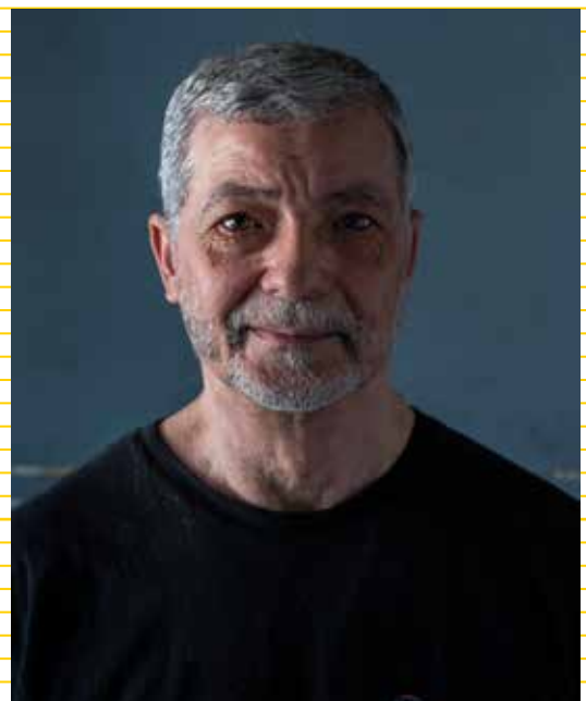
Ouvrier de chez AB Fonderie à Saint-Genis-Laval (69). Musée d'histoire de Lyon - Gadagne. Photo ©Valérie Couteron (2022).