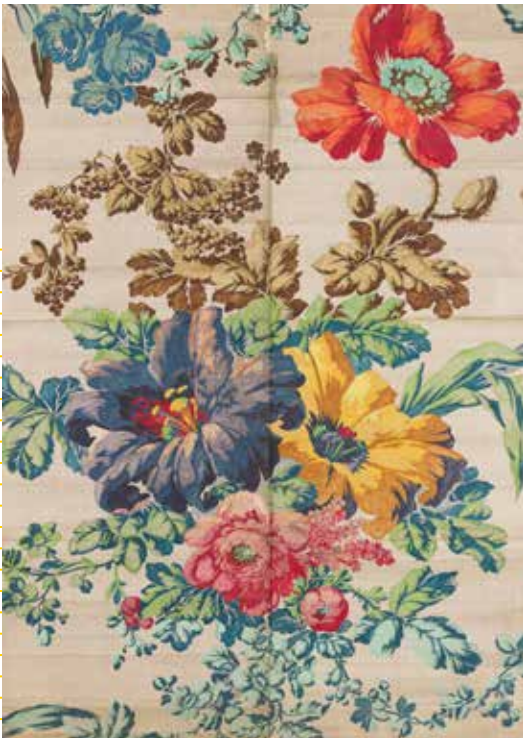
Détail d'un patron de tissage (mise en carte) pour tissu façonné. Papier. Lyon. Vers 1854. Institution détentrice : Manufacture Prelle.

Un espace sensoriel invite le public à toucher différents échantillons de tissus afin de comprendre les différentes étapes, en amont et en aval du tissage (cocons, flotte de soie...), les différentes manières de tisser (armures sergé, satin et toile) et l'évolution des textiles jusqu'à nos jours. (Espace réalisé en partenariat avec différentes entreprises dont la Holding Textile Hermès, Denis & fils et Europrotect).