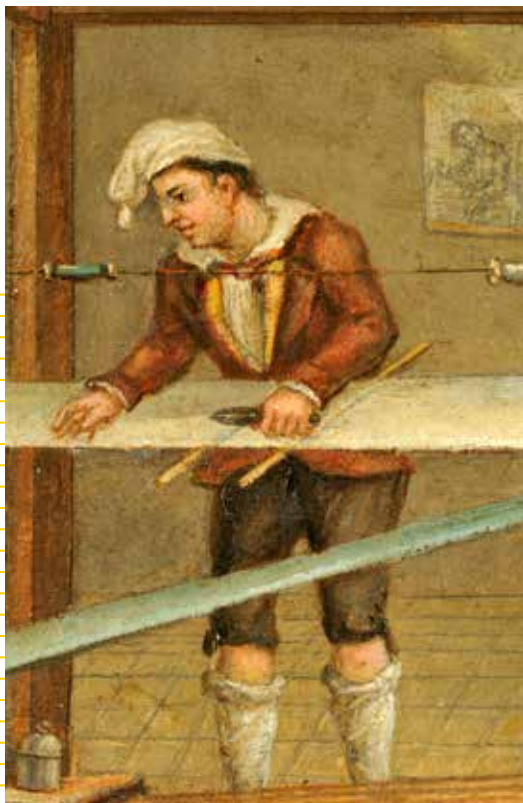
Intérieur d'un atelier de canut (détail). Huile sur carton. Balthazar Alexis. 19 e siècle. Musée d'histoire de Lyon - Gadagne.