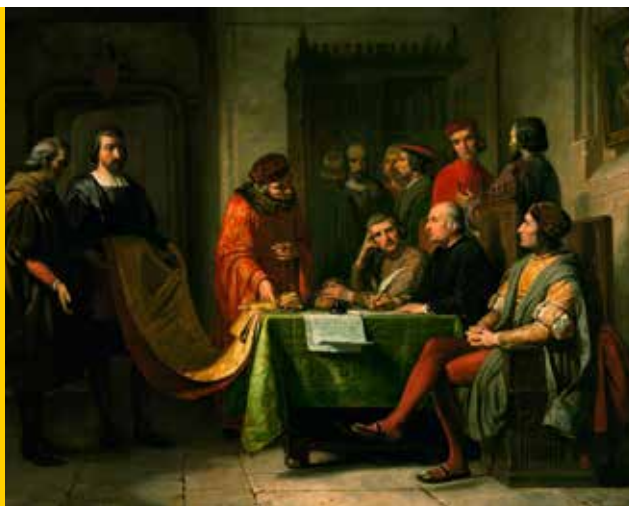
Origine de la fabrication des étoffes de soie à Lyon en 1536. Thomas II de Gadagne présentant au consulat – pouvoir municipal de l'époque – Naris et Turquet pour un projet de développement de la soie. Peinture à l'huile. Pierre Bonirote. 1849. Tableau : dépôt du Musée des Beaux-Arts de Lyon.