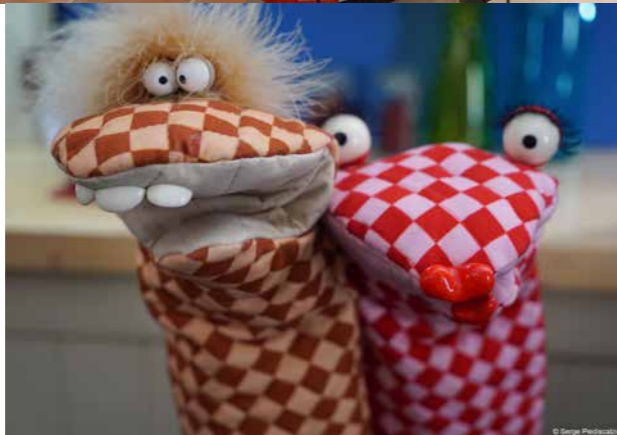
Publicité Lustucru