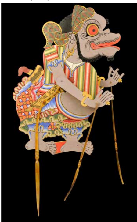
Togog, wayang kulit, Java, vers 1850

Ces différentes traces très anciennes témoignent du caractère universel voire anthropologique des marionnettes ainsi que de leurs circulations et appropriations culturelles.