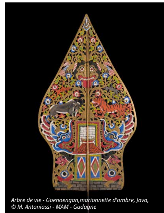
Arbre de vie - Goenoengan, marionnette d'ombre, Java, © M. Antoniassi - MAM - Gadagne