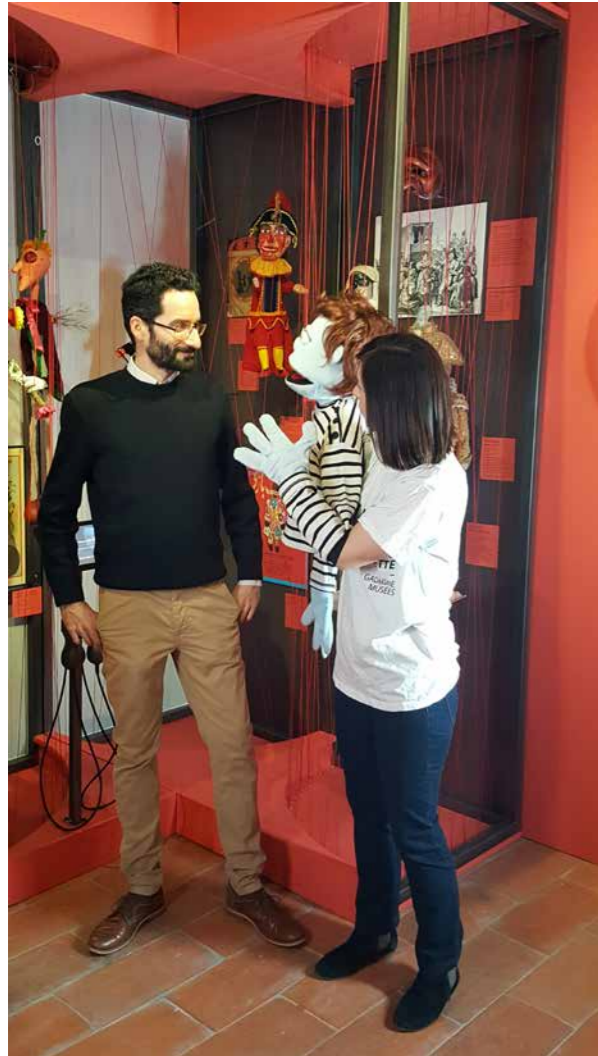
les salles du MAM