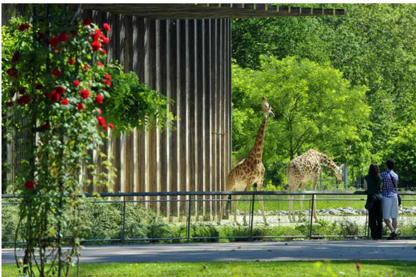
Zoo de Lyon