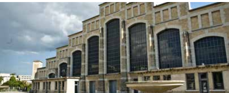
Halles T. Garnier

L'urbanité est un enjeu majeur pour les années à venir dont on peut pointer ici quelques dynamiques parmi d'autres