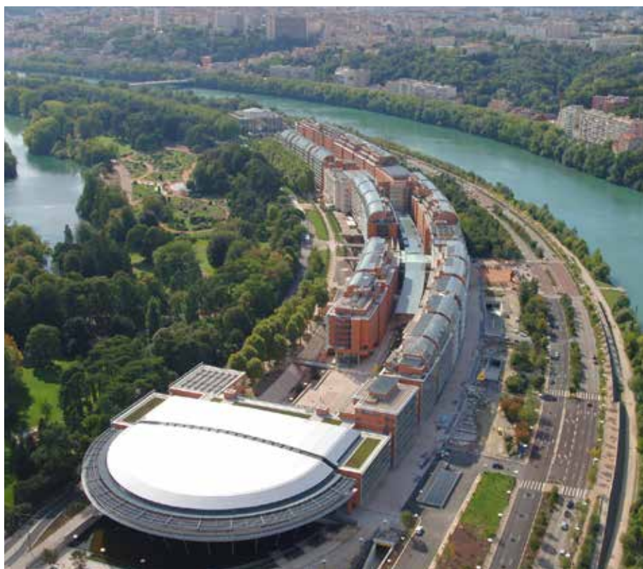
Cité internationale