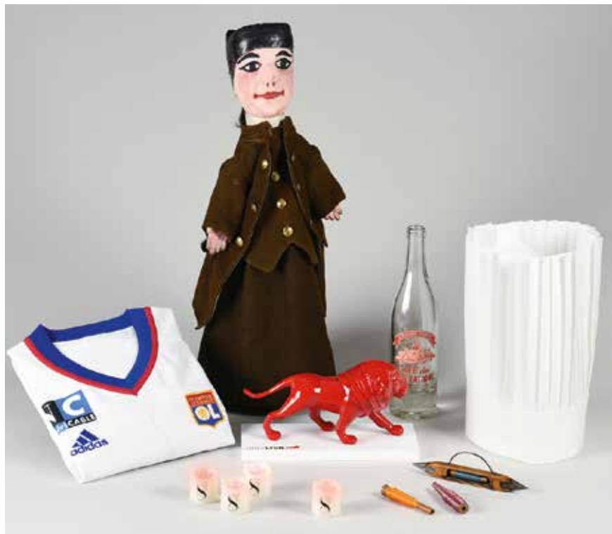
Les objets