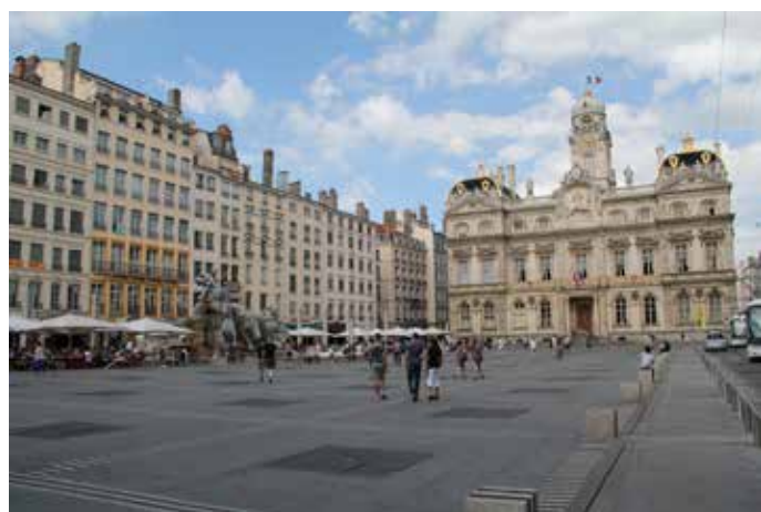
Place des Terreaux

Connaître S'approprier des repères spatiaux (maquette) et temporels ; s'approprier un vocabulaire spécifique ; s'interroger sur des notions (qu'est-ce qu'une ville?) ; se construire un jugement étayé, construit, argumenté ; apprendre à contextualiser (contextualisation spatiale et temporelle) des événements, des objets, des lieux, des paysages.