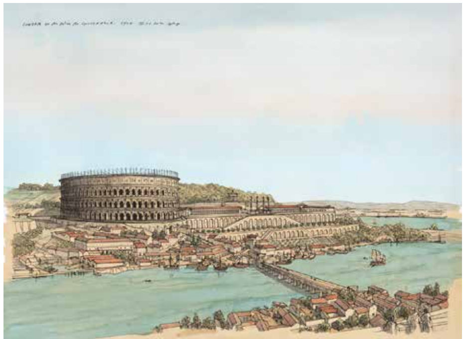
Lugdunum, Lyon au 2 e siècle après J.-C. Dessin de restitution (reproduction), 2010 Jean-Claude Golvin (né en 1942), architecte et archéologue Musée départemental Arles Antique