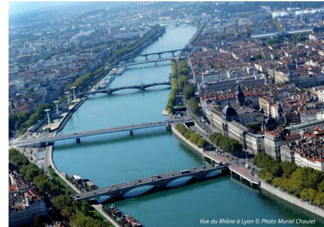
Vue du Rhône à Lyon