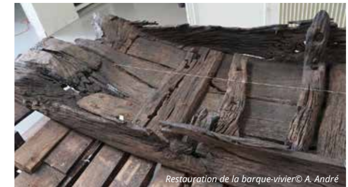
Restauration de la barque-vivier

L'embarcation est à mettre en relation directe avec l'activité portuaire et marchande du site connue depuis l'Antiquité. Le poisson pêché dans la Saône était directement vendu à proximité sur le marché et conservé vivant dans le vivier de l'embarcation.