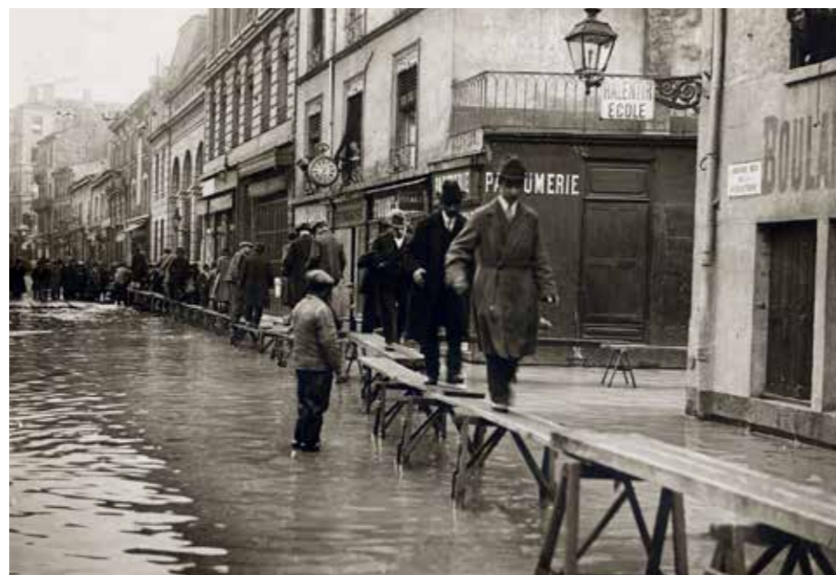
Passerelles de bois dans la Grande rue de la Guillotière Service photographique du Progrès Tirage photographique Lyon, 1928

Lors de ces inondations, le Rhône noie les deux tiers de Villeurbanne et un tiers de la ville de Lyon ; le bilan des destructions est considérable : maisons écroulées par centaines, axes de communication coupés, ponts détruits. Cette catastrophe fait 18 morts et des milliers de sans-abris.