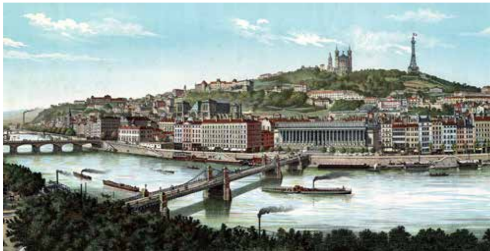
Le coteau de Fourvière (détail), gravure, anonyme, 1 er quart du 20 e s Coll. Gadagne

Saïd , présent à la fin de l'exposition, témoigne des grands aménagements du 20 e siècle.