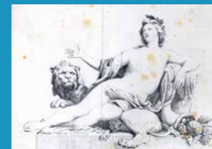
Allégorie du Rhône, lithographie d'après la sculpture de G. Coustou.