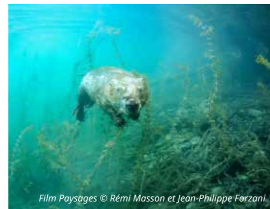
Film Paysages © Rémi Masson et Jean-Philippe Forzani