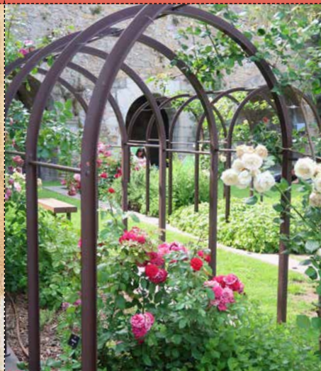
LE JARDIN Gadagne