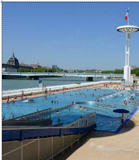
● LE CENTRE NAUTIQUE TONY BERTRAND Ville de Lyon