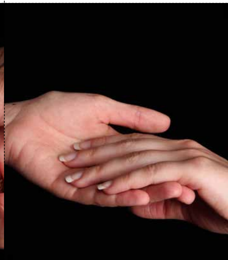
L'ACCUEIL Métiers du musée