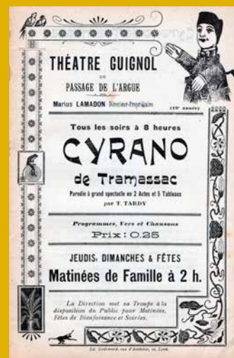
L'AFFICHE DE SPECTACLE Guignol