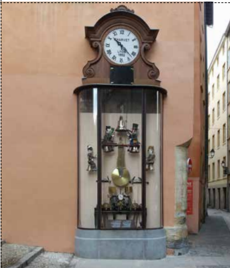
L'HORLOGE CHARVET Gadagne