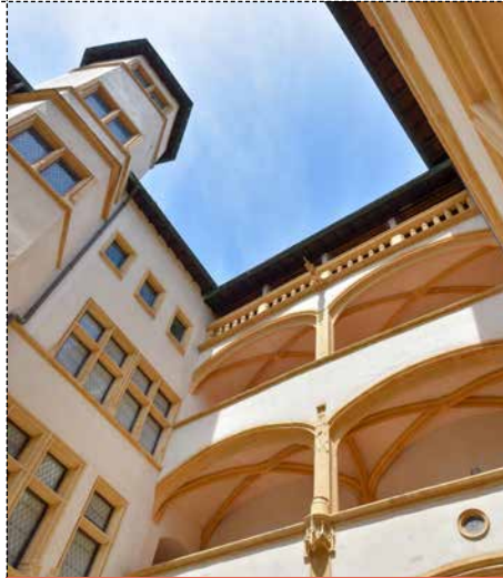
LA GALERIE Gadagne