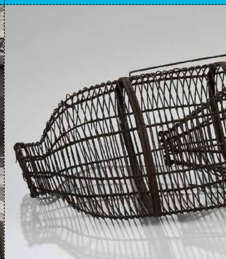
LA NASSE À ANGUIILLES Les pieds dans l'eau