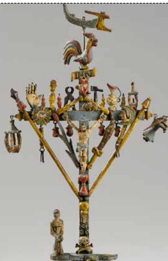
LA CROIX DE MARINIER Les pieds dans l'eau