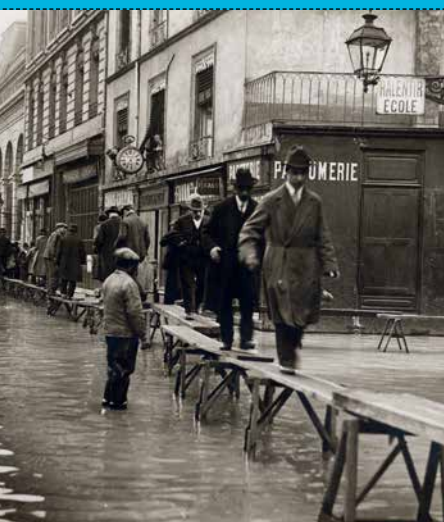
L'INONDATION À LA GUILLOTIÈRE Les pieds dans l'eau