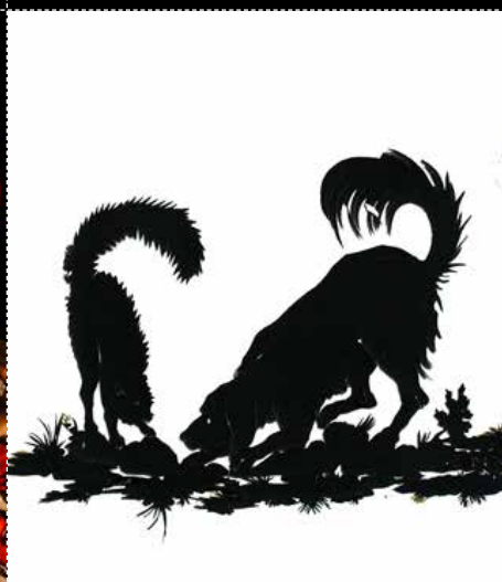
THÉÂTRE DU CHAT NOIR Ombres