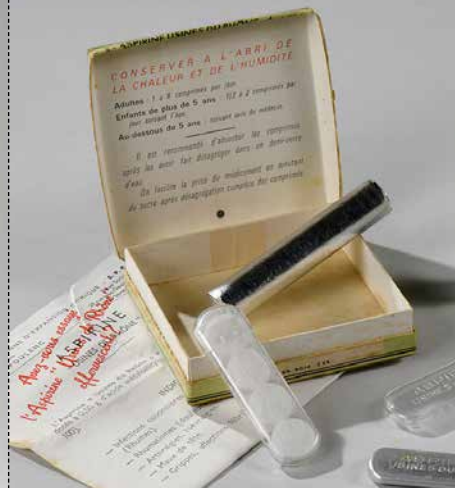
L'ASPIRINE DU RHÔNE Les pieds dans l'eau