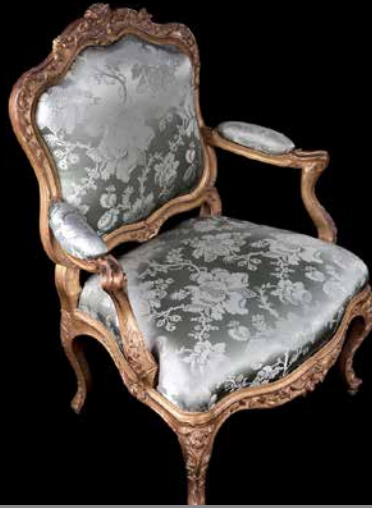
LE FAUTEUIL À LA REINE Histoire de Lyon