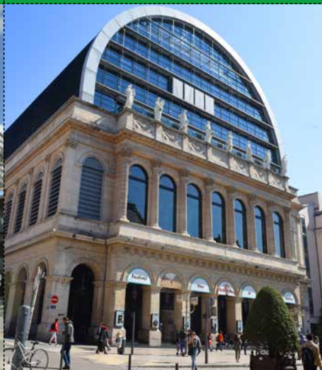
● L'OPÉRA Ville de Lyon