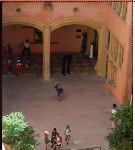
LA COUR Gadagne