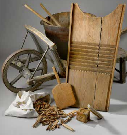
LA LAVANDIÈRE Les pieds dans l'eau