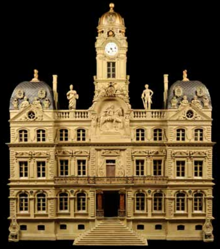
L'HÔTEL DE VILLE Histoire de Lyon