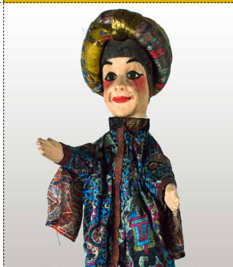
GUIGNOL EN HABIT ORIENTAL Guignol