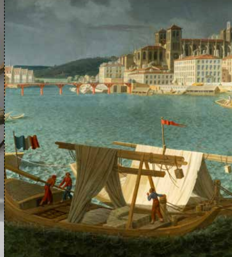
LA SAÛNE Les pieds dans l'eau