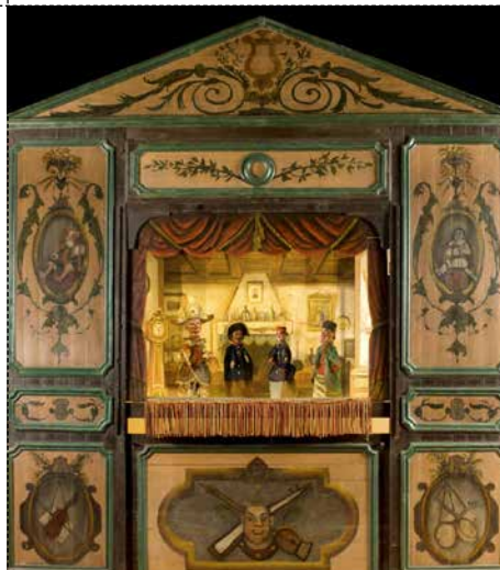
LE CASTELET Guignol