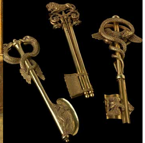
LES CLÉS DE LYON Histoire de Lyon