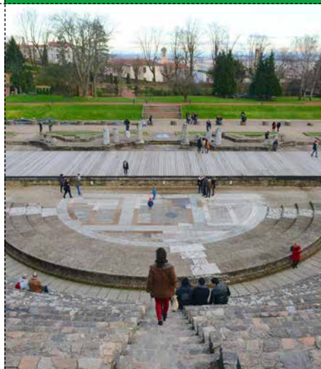
● LE THÉÂTRE ANTIQUE DE LUGDUNUM Ville de Lyon