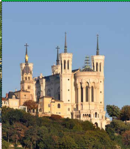
● LA BASILIQUE DE FOURVIÈRE Ville de Lyon