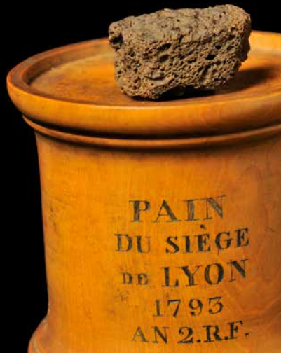
LE PAIN DU SIÈGE Histoire de Lyon