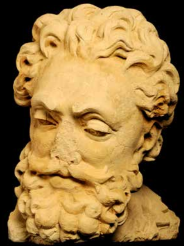
HENRI IV Histoire de Lyon