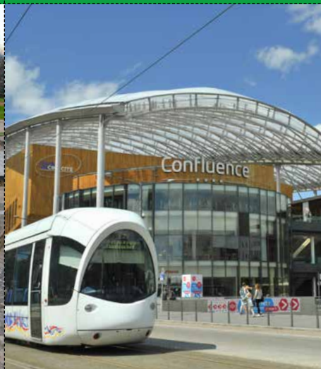
● LE CENTRE CONFLUENCE Ville de Lyon