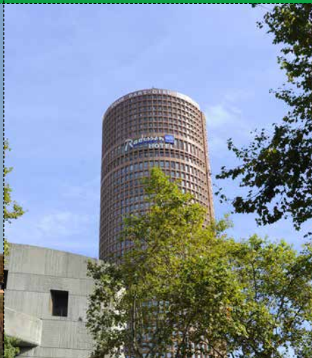
● LA TOUR PART-DIEU Ville de Lyon