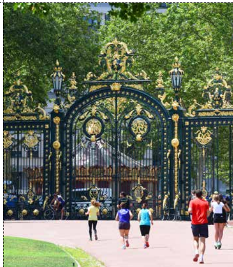
● LE PARC DE LA TÊTE D'OR Ville de Lyon