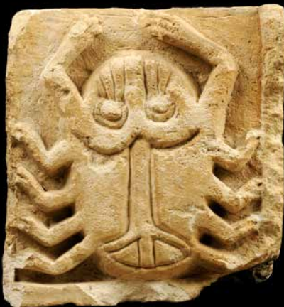
LE CANCER Histoire de Lyon