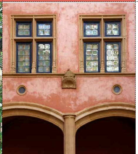
LES FENÊTRES Gadagne