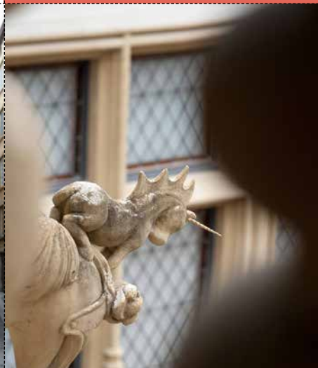
LA LICORNE Gadagne