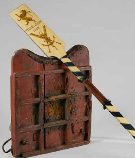
LES JOUTES Les pieds dans l'eau