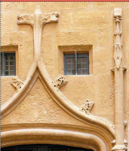
LA PORTE Gadagne