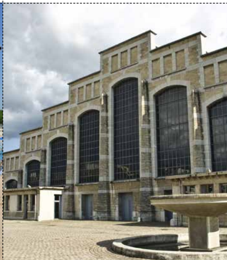
● LA HALLE TONY GARNIER Ville de Lyon