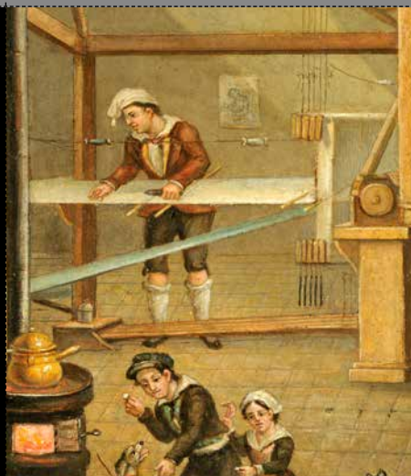
L'ATELIER DE CANUT Histoire de Lyon