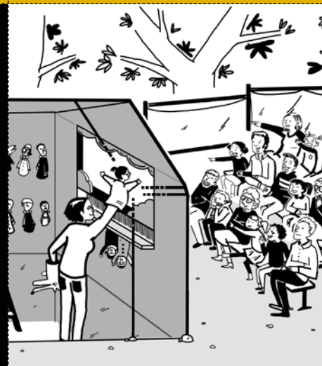
LE THÉÂTRE Guignol