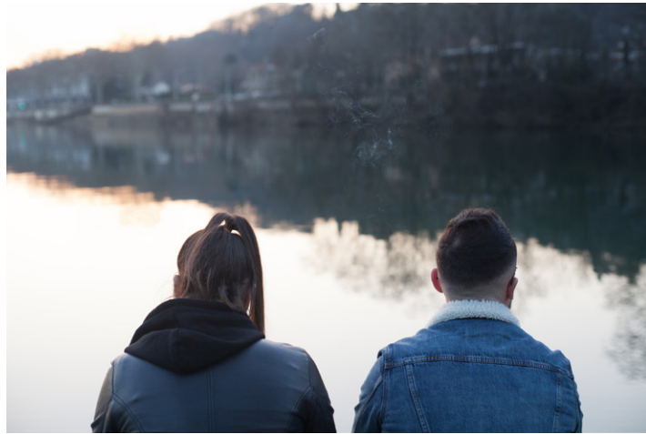
Île Barbe