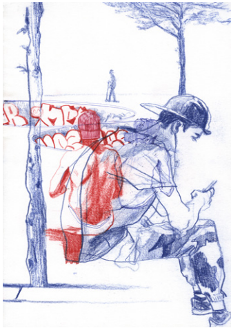
Place Raspail © Dessin Laurent Bonneau