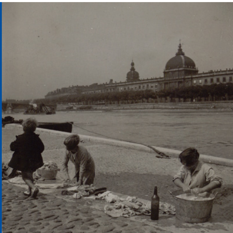
Lessive sur les bords du Rhône, tirage photographique, vers 1934, Théo Blanc et Antoine Demilly / Musée d'histoire de Lyon – Gadagne

Dans le cadre du grand projet de modernisation de ses espaces d'exposition permanente, dans une actualité marquée par les enjeux écologiques et une nouvelle envie de vivre la ville, le MHL propose aux visiteur-euses (en particulier aux enfants à partir de 5 ans accompagnés d'un-e adulte) d'explorer la Saône et le Rhône, la rivière et le fleuve qui irriguent le territoire lyonnais et font partie de son histoire et de son identité. Depuis leur installation, les Lyonnais-es vivent avec les deux cours d'eau, une histoire d'amour... tumultueuse !