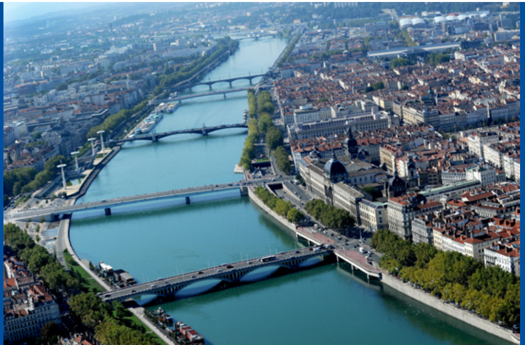
Vue du Rhône à Lyon