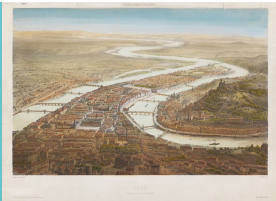
Lyon vue de la Croix-Rousse, 1860, Alfred Guesdon / Musée d'histoire de Lyon - Gadagne