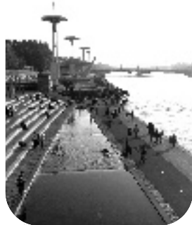
• Les berges du Rhône, 2009

A lors que ces cinquante dernières années ont été des périodes de profondes et rapides transformations urbaines , la Ville de Lyon rénove et restructure l'un des rares et des plus anciens musée d'histoire de ville en France. Cette dynamique est partagée par de grandes métropoles. Nantes, Strasbourg, Amsterdam, Bruxelles, Leipzig ou Madrid... rénovent ou créent leur musée d'histoire. Le nouveau musée d'histoire de Lyon qui ouvre en juin 2009 est un lieu ressource pour comprendre la ville, dans toutes ses composantes. Ouvert sur les enjeux urbains , il se veut également espace de réflexion et de rencontre sur la ville grâce à de multiples partenariats et à une solide implantation territoriale.