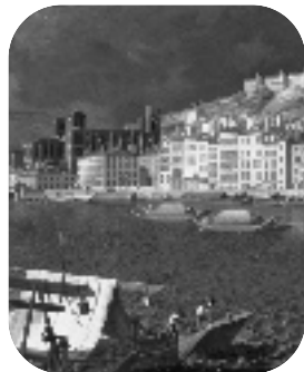
• Bords du Saône à Lyon, • Nivard, 1804 (détail)