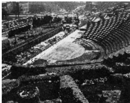
Le théâtre gallo-romain de Fourvière