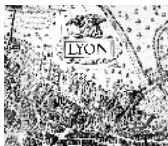
Plan scénographique, 1545 (détail)

* À voir... quelque part en ville* (*patrimoine in situ) : le théâtre de Fourvière (5 e arrt.) ; jardin archéologique de Saint-Jean / église Saint-Etienne (5 e arrt.)