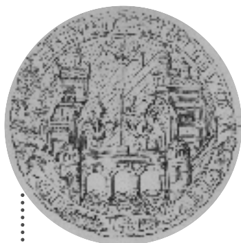
Le sceau de la ville, 1320

* À voir... quelque part en ville : la galerie Philibert Delorme (5 e arrt.), le porche Saint-Nizier (2 e arrt.), l'ensemble Gadagne (5 e arrt.)