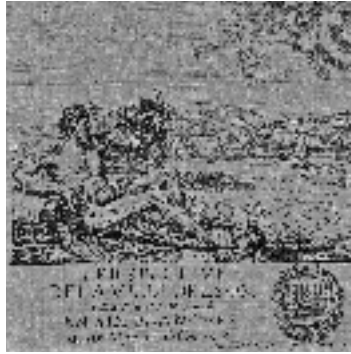
• Perspective de la ville de Lyon, Israël Silvestre, 1651 (détail)