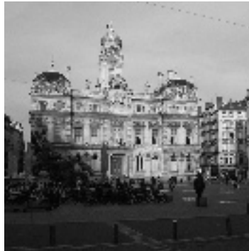
• L'hôtel de ville