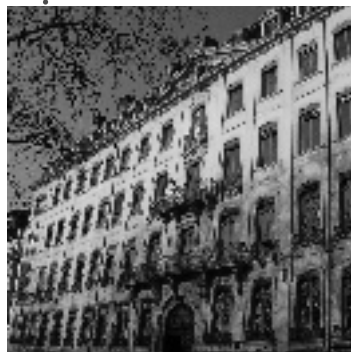
• La maison Tolozan par Delamonce

* À voir... quelque part en ville : la maison Tolozan et le quartier Saint-Clair (1 e arrt.) ; l'église Saint-Bruno (1 e arrt.) ; l'hôtel particulier Villeroy (2 e arrt.)