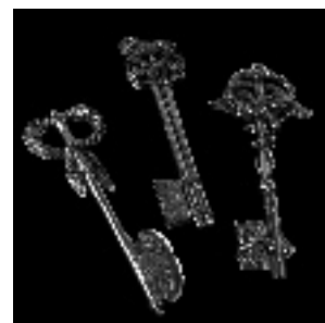
• Les clés de la ville de Lyon, Chinard, Saulnier, 1805

* À voir... quelque part en ville : les pentes de la Croix-Rousse (1 e arrt.), la rue de la République (2 e arrt.), le parc de la Tête d'Or (6 e arrt.), Fourvière (5 e arrt.)