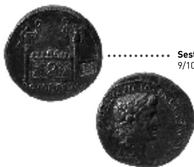
Sesterce à l'autel des 3 Gaules, 9/10 - 14 ap. J.-C.