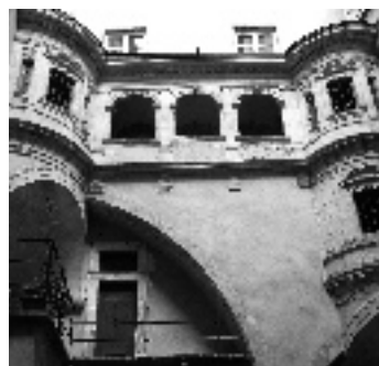
La galerie Philibert Delorme