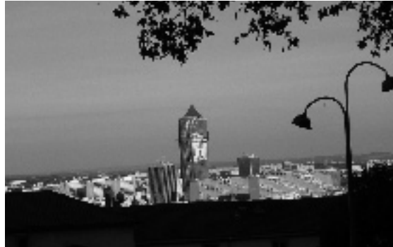
..... La tour de la Part-Dieu