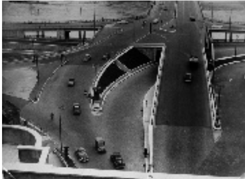
• Échangeur à Lyon, • Blanc et Demilly, 1950