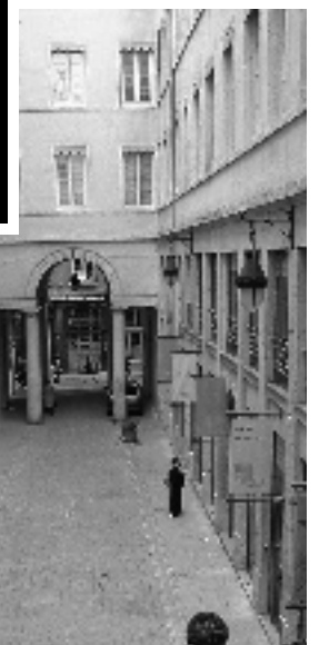
• Le passage Thiaffait dans la Croix-Rousse