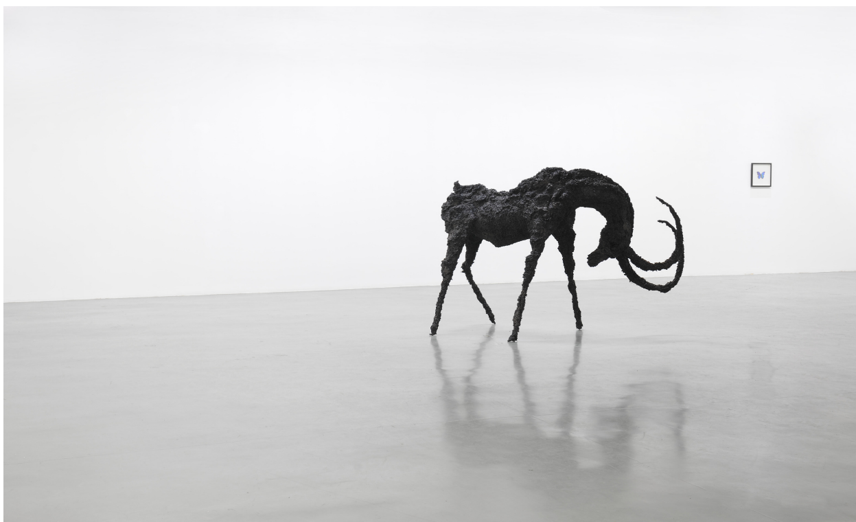
Bouc d'Avril - 2015 Thé, eau de pluie, colle sur structure métallique 158 x 220 x 117 cm