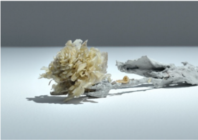
Printemps 2016, détails

«Au printemps le dormeur, surpris par l'aube, Entend partout gazouiller les oiseaux. Toute la nuit, bruit de vent et de pluie : Qui sait combien de fleurs ont dû tomber!?! »