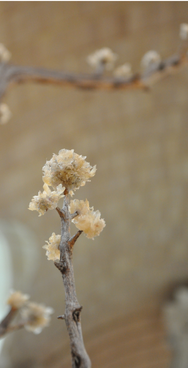
Printemps 2016, Vue d'exposition Chapelle des Calvairiennes, Mayenne (2016)

L'art questionne ainsi les fondements du beau et de l'esthétique. Ces trois mûriers de vers à soie sont également l'occasion de rendre hommage à l'histoire de la ville de Lyon : s'inscrivant dans une tradition de production de soieries initiée au XV ème siècle, ils célèbrent également le 400 e anniversaire de la mort d'Olivier de Serre qui fit de Lyon la capitale de la soie. L'installation met ainsi à l'honneur celle qui fut autrefois la plus précieuse des marchandises et qui fut au cœur des échanges entre l'Asie et l'Europe pendant des siècles, transitant sur la fameuse Route de la soie.