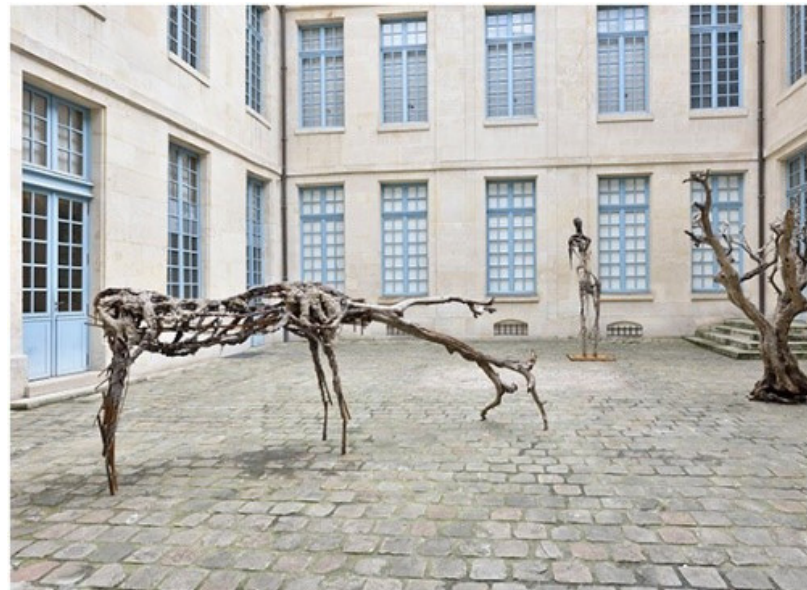
La sélection de parentèle – Solo Show Musée de la Chasse et de la Nature, Paris, 2017