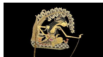
Marionnette d'ombres © Schwebel

Historiquement et dans de nombreuses cultures, la marionnette est médiatrice entre la vie et la mort, le sacré et le profane. Ainsi, les marionnettes javanaises par exemple sont les intercesseurs entre le monde des vivants et l'au-delà ; il en va ainsi dans plusieurs cultures asiatiques et dans certaines cultures africaines.