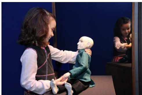
MAM, marionnette de l'Ateuchus

Dans les arts de la marionnette, le regard du manipulateur sur la marionnette est absolument central : c'est en effet celui-ci qui donne vie à l'objet. C'est par son regard que le manipulateur oriente l'attention du spectateur et s'efface au profit de la marionnette. Plusieurs marionnettistes témoignent ainsi de la possibilité d'animer, c'est-à-dire de donner vie à la marionnette sans même la toucher, la manipuler ; en se contentant de la faire exister par l'interaction du regard.