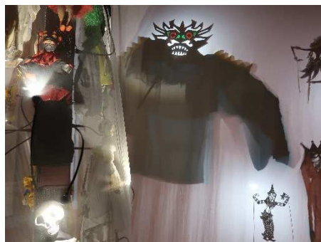
MAM, marionnettes d'ombres de Lescot

Que ce travail se fasse lors de l'analyse d'un spectacle ou bien dans une démarche de création artistique, il s'agit là d'une amorce de travail sur l'identité qui peut être particulièrement féconde.