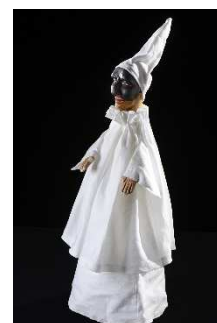
Pulcinella, © Aubert

C'est à l'époque moderne que la circulation européenne et les appropriations culturelles deviennent très fortes. En effet, à partir de 1610, à Lyon puis à Paris, on voit importés et appropriés les Burratini italiens qui deviennent Polichinelle. En France, ils sont au cœur des polémiques entre l'Opéra et la Comédie Française liées à l'institutionnalisation du Théâtre.