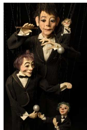
Le marionnettiste de Valdès

La marionnette est donc à la fois un objet qui rassemble, car universel et anthropologique ; un objet qui circule – qui crée donc le lien, les échanges et témoigne des syncrétismes ; et un objet qui permet d'aborder la question de l'Altérité sous des formes complexes et variées.