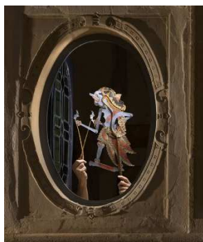
Marionnette indonésienne, wayang kulit

Elles tiennent une place importante dans la vie religieuse puisqu'elles prennent part au culte des ancêtres, elles sont considérées comme des médiums mobilisés par les morts pour entrer en communication avec les vivants, et servent également les épopées et récits mythologiques de création du monde.