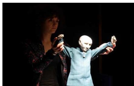
MAM, marionnette de l'Ateuchus, © Dumont