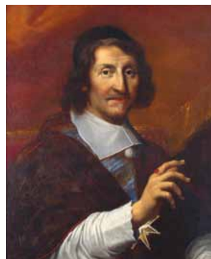
Portrait de Camille de Neuville de Villeroy, huile sur toile, Thomas Blanchet, 2 e moitié du 17 e s., Inv. N 2660

La famille de Neuville de Villeroy s'illustre également dans la carrière religieuse. C'est à l'âge de 5 ans que Camille de Neuville de Villeroy est nommé abbé commendataire d'Ainay, en 1611 ! Ainsi, il perçoit les revenus de l'abbaye, sans toutefois exercer d'autorité sur la discipline intérieure des moines. Il étudie chez les Jésuites puis à Rome, où il devient théologien. En 1618, il est fait abbé de l'Île Barbe, où il s'illustre en reconstruisant l'église détruite par les protestants en 1562. Puis il devient abbé commendataire de Mozac (basse Auvergne) de 1641 à 1655. C'est en remerciement de sa fidélité au roi, en tant que lieutenant général de Louis XIV lors de la Fronde, que la reine lui propose le siège d'archevêque de Lyon, qu'il accepte bien que peu intéressé par la vie ecclésiastique. Sacré en juin 1654, il devient dans le même temps comte de la ville et primat des Gaules*. Partisan de la réforme catholique, il entreprend de réinstaurer la discipline dans le clergé régulier et séculier du diocèse, privilégiant toujours la négociation à la contrainte. À Lyon, il favorise aussi l'installation de nouveaux ordres religieux et aide au développement des couvents, féminins notamment. Sa bibliothèque, parmi les plus belles de France – avec plus de 5000 volumes ! – est léguée aux Jésuites de la Sainte Trinité.