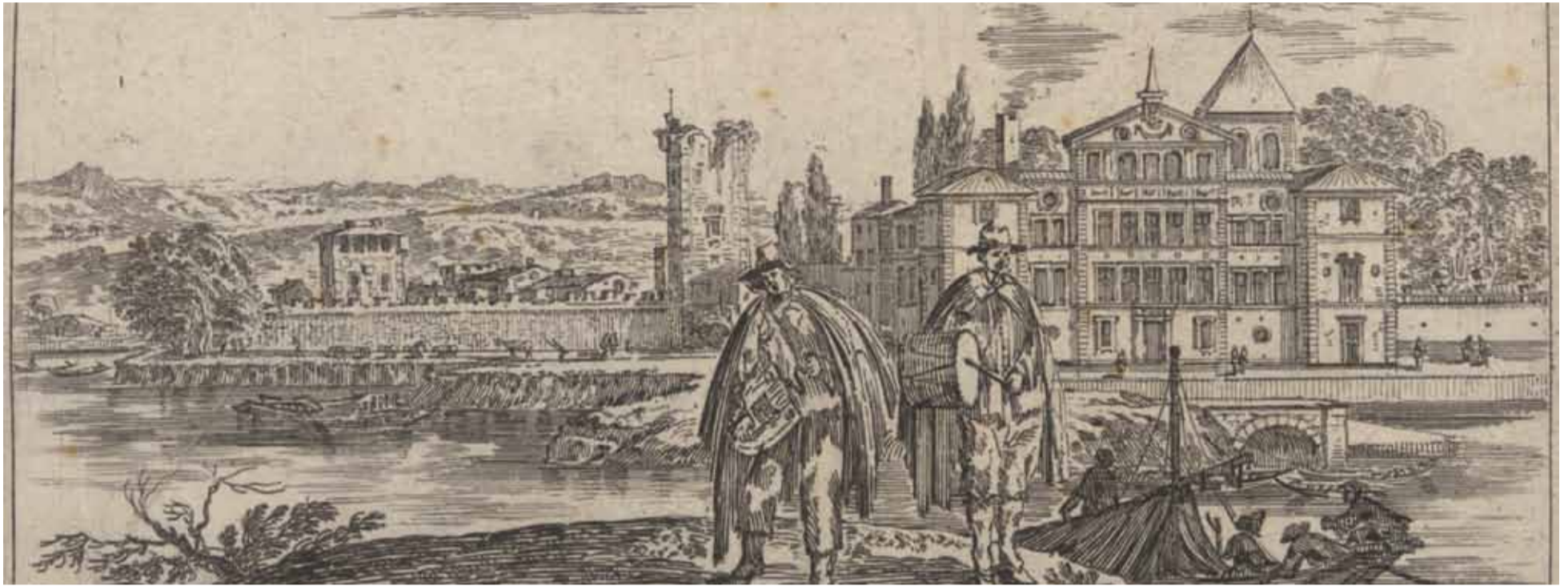
Maison de Vimy près de Lyon, résidence de la famille de Neuville de Villeroy, actuellement Neuville sur Saône, gravure, Israël Silvestre, 17 e s., Inv. 46.434