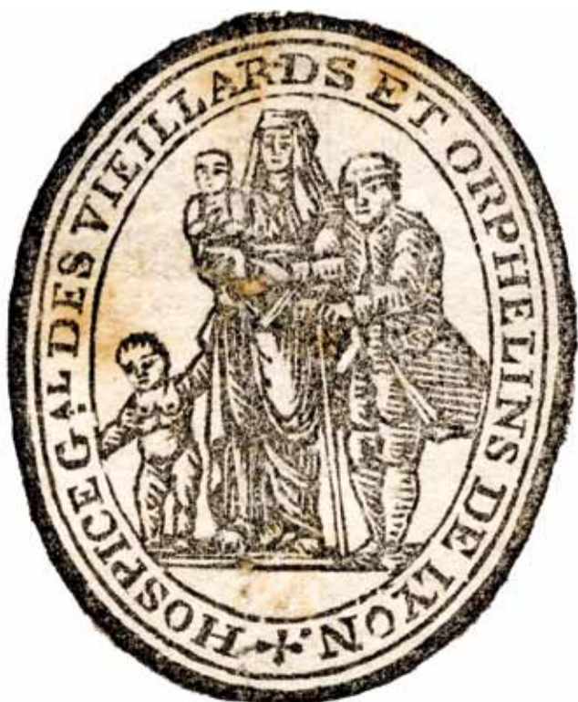
Hospice général des vieillards et orphelins de Lyon, timbre et cachet de l'hôpital de la Charité, anonyme, date inconnue, Inv. 1579.6

Une Aumône générale permanente (Inv. 41.197 Plaque de l'Aumône générale ) est alors créée par le Consulat, en 1533.