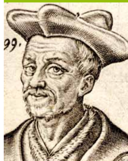
Portrait de François Rabelais, gravure, anonyme, 16 e s., Inv. 55.155

Rabelais, nommé médecin du Grand Hôtel-Dieu en 1532, reste dans les souvenirs comme un bon médecin, attentif aux malades. Il est l'inventeur de deux instruments de chirurgie : un syringotome pour débrider les hernies et un glottocomon pour réduire les fractures du bassin. En 1534, il quitte précipitamment la ville et son poste : face à la montée du protestantisme, traité par Calvin de "porceau libertin", il ne se sent plus en sécurité. Mais il a pris soin de se faire remplacer par des confrères.