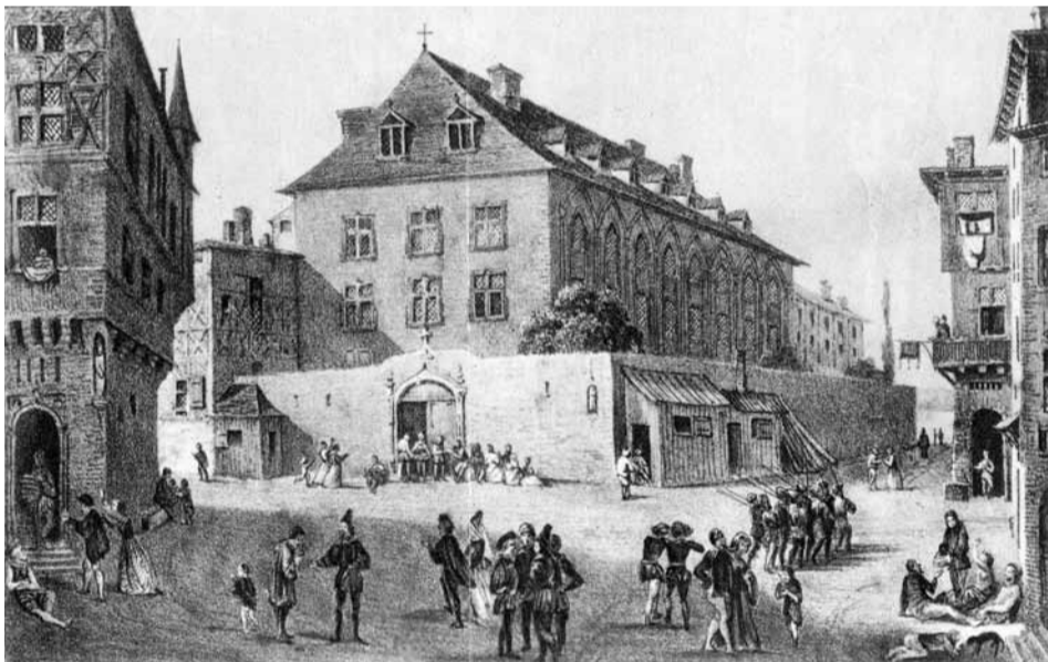
L'Hôtel-Dieu au 16 e s., à l'époque où Rabelais y pratique la médecine, reproduction d'une lithographie, graveur anonyme, 16 e s., Inv. 52.28

En 1478, devant l'ampleur de l'épidémie de peste, le Consulat prend le contrôle de l'ensemble hospitalier. Vers 1507, les échevins font construire un grand hôpital à l'emplacement de l'actuelle chapelle de l'Hôtel-Dieu : le Grand Hôtel-Dieu de Notre-Dame de Pitié du Rhône, qui se développe au 16 e s. grâce aux dons immobiliers et monétaires des bourgeois. En 1530 le roi François 1 er l'exempte d'impôt et de droit de péage. En 1583, son administration est confiée à des bourgeois et à des marchands.