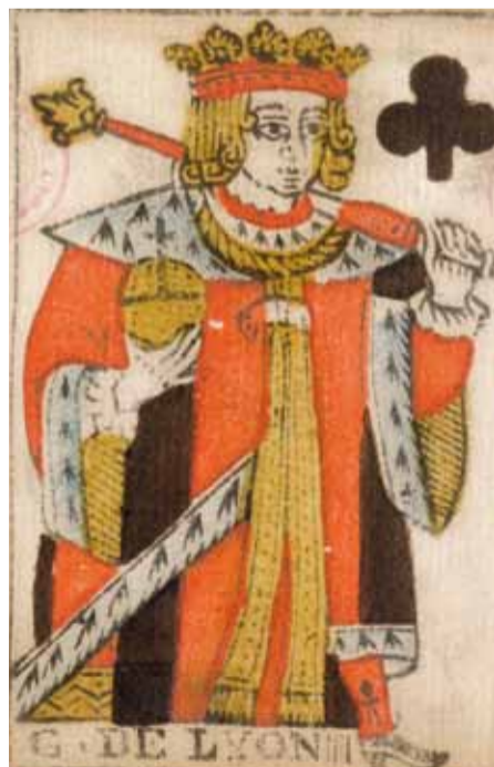
Roi de trèfle, carte à jouer au portrait de la Généralité de Lyon, anonyme, 17 e s., Inv. 42.235.7

Il semble que les femmes n'aient pas inspiré les graveurs de Lyon : leur visage manque de charme et leur attitude demeure raide, alors que les hommes, rois ou valets, ont belle allure.