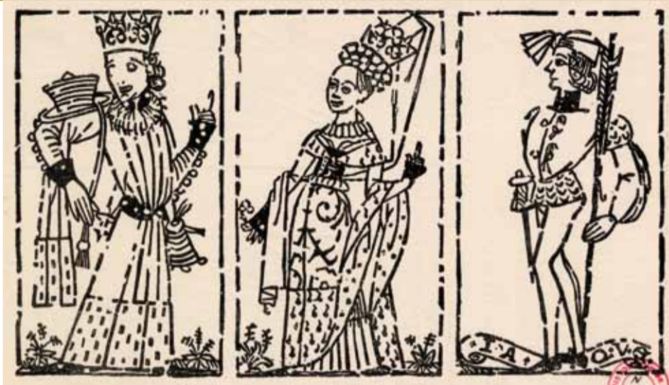
Cartes à jouer lyonnaises, tirées sur un bois gravé de l'atelier Vital Berthin, graveur Maître Jacques, fin 15 e s., Inv. 466.6