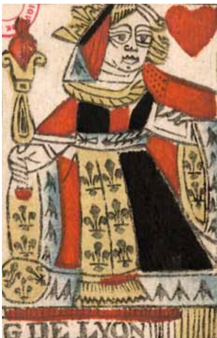
Dame de cœur, carte à jouer au portrait de la Généralité de Lyon, anonyme, 17 e s., Inv. 1564.1.4