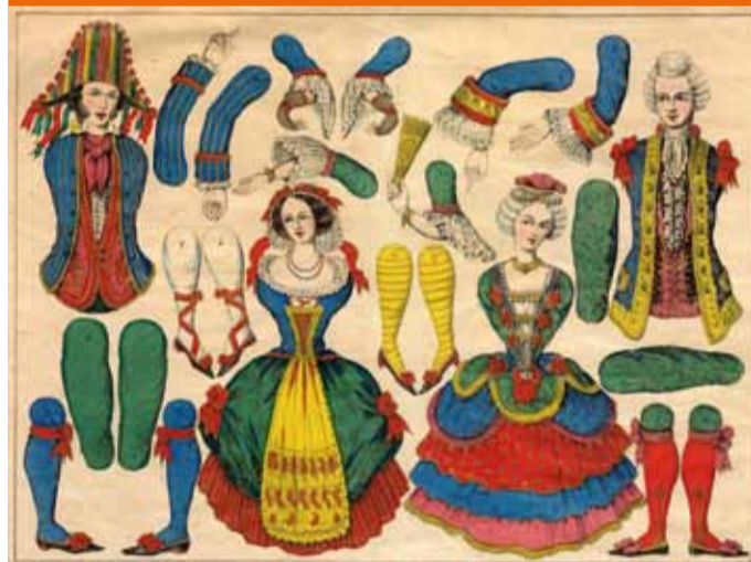
Pantins - Marquis et marquise, planche d'images de la fabrique Pellerin, Épinal

Bien souvent, les planches de décors de l'Imagerie Pellegrin représentent des constantes - le Palais, la Marine, la Campagne - ou des lieux identifiés de la ville d'Épinal - la prison, la caserne.