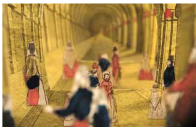
Histoire du tunnel sous la Tamise, scène de théâtre de papier représentant une visite sous le tunnel construit entre 1824 et 1844 par Sir Isambard Marc Brunel, vers 1850, Londres, Collection Dor

Au 18 e s., c'est pour que les plaisirs du théâtre se poursuivent après la représentation que l'on vend aux spectateurs des planches imprimées sur lesquelles figurent les acteurs qu'ils viennent de voir sur scène.