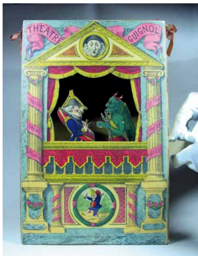
Théâtre Guignol, théâtre de papier, B. Coudert, 19 e s., France, Collection Dor

(Notice du nouveau théâtre portatif à rainures de P. Clerc)