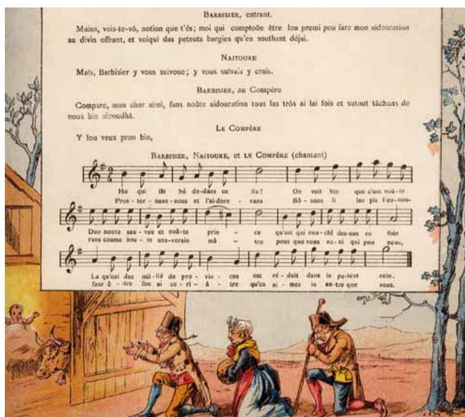
La crèche : drame populaire en patois de Besançon, L. Androt, 1889, fonds L. Dor

Le répertoire religieux ne constitue pas l'essentiel des pièces : le théâtre Joly joue également des drames et des comédies.