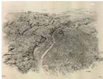
Vue perspective reconstituée de Lyon, Villeurbanne, Caluire, Saint-Cyr, Saint-Didier, Tassin, Sainte-Foy. David, dessinateur. Dessin au crayon noir (reproduction), 1974