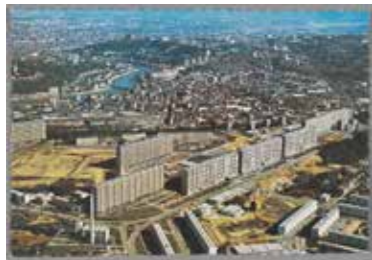
Vue aérienne de Lyon depuis la Duchère. Carte postale (reproduction), vers 1965