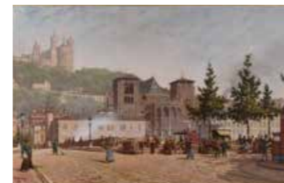
Le Pont Tilsitt, Victor Ducrot (1852 – 1912). Huile sur toile, 1889 - musées Gadagne