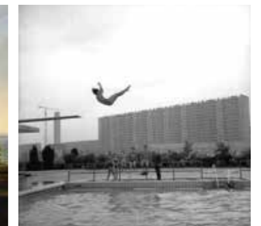
Quartier de la Duchère : Piscine, Georges Vermard, tirage photographique, années 1960 – Bibliothèque municipale de Lyon