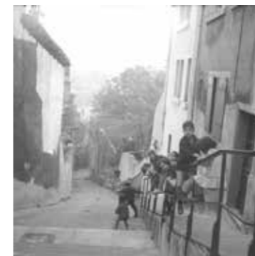
L'Escalade, Tirage photographique, 20 e s