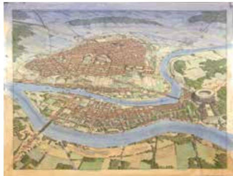
Lyon au XV e siècle. Dessin de restitution (reproduction) 2010, Jean-Claude Golvin (né en 1942), architecte et archéologue – Musée départemental Arles Antique