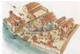
La reconstruction de la cathédrale Saint-Jean au 12 e siècle. Dessin de restitution (reproduction), 2007 Claude Quiec (né en 1962), illustrateur