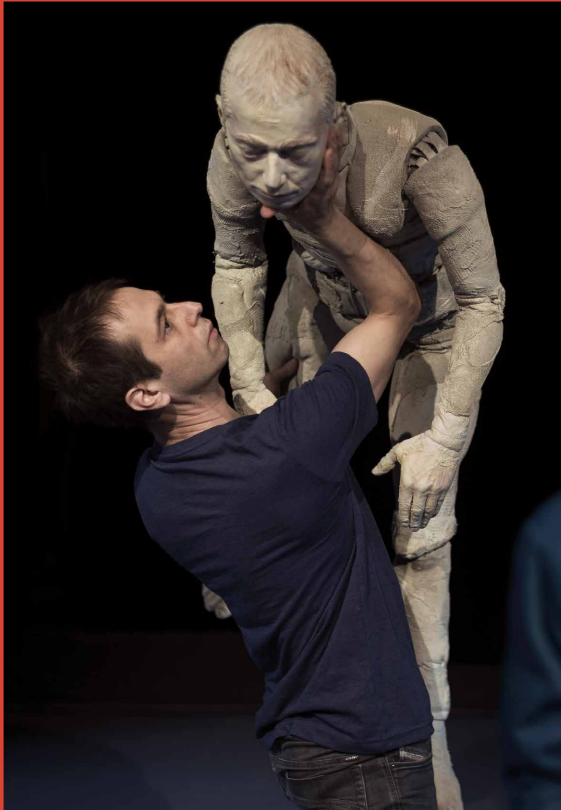
LA VIE DES FORMES, photographie Benoit Schupp