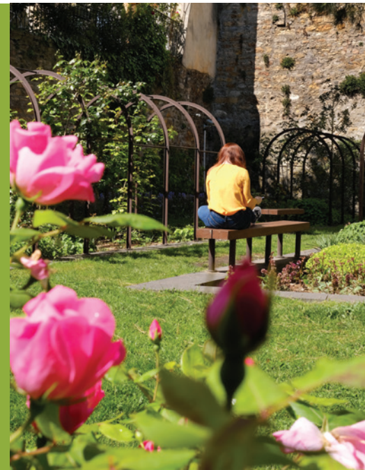
Jardins de Gadagne

Île Barbe - Lyon Place Raspail © Dessin Laurent Bonneau