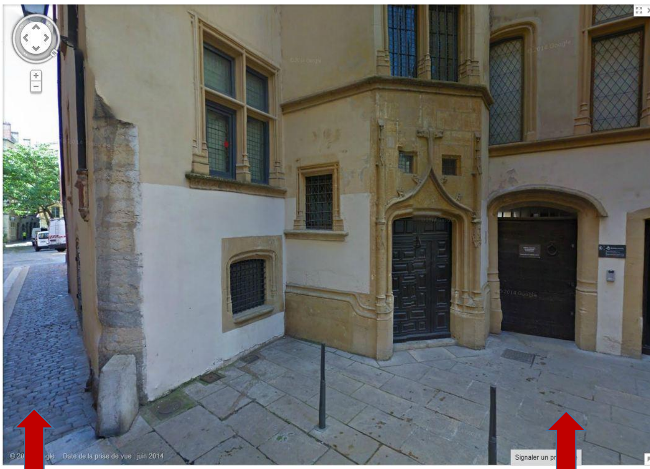
Rue Gadagne, arrivée depuis le métro Vieux Lyon