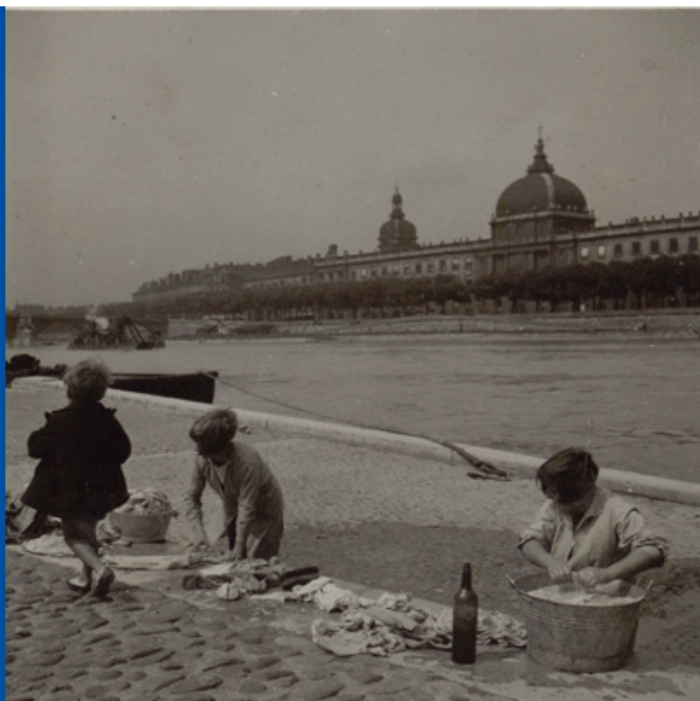
Lessive sur les bords du Rhône, tirage photographique, vers 1934, Théo Blanc et Antoine Demilly / Musée d'histoire de Lyon – Gadagne

Dans le cadre du grand projet de modernisation de ses espaces d'exposition permanente, dans une actualité marquée par les enjeux écologiques et une nouvelle envie de vivre la ville, le MHL propose aux visiteur-euses (en particulier aux enfants à partir de 5 ans accompagnés d'un-e adulte) d'explorer la Saône et le Rhône, la rivière et le fleuve qui irriguent le territoire lyonnais et font partie de son histoire et de son identité. Depuis leur installation, les Lyonnais-es vivent avec les deux cours d'eau, une histoire d'amour... tumultueuse !