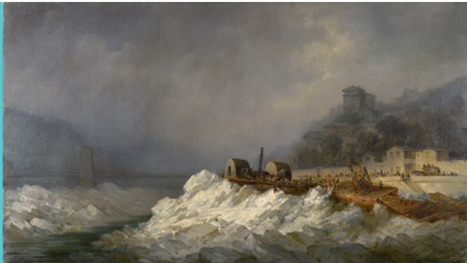
Le bateau à vapeur « Le Vengeur » pris dans les glaces de la Saône en 1866, huile sur toile, Joseph Desombres / Musée des Beaux-Arts de Lyon, inv. X 892 / Photo : Pierre Aubert