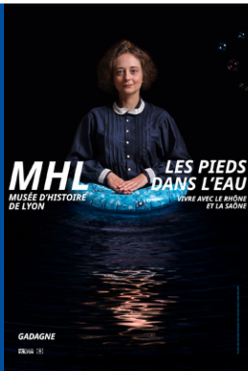
Affiches de l'exposition permanente : Conception, Atelier Claire Rolland et Scenorama Photographie, Un jour dans le temps

Dans le parcours Les Pieds dans l'eau , quatre personnages incarnent ainsi la petite histoire dans la Grande histoire de Lyon : Louise, lavandière qui a vécu à la fin du 19 e siècle avec son mari Frédéric, conducteur de remorqueur à vapeur, et leur fils Rémi (5 ans) qui rêve de devenir cheminot. Saïd, présent à la fin du parcours, témoigne des grands aménagements sur le Rhône et de leurs impacts sur la société et l'environnement au milieu du 20 e siècle.