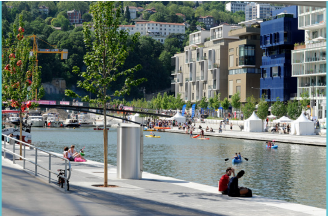
Le port de Saône à la Confluence à Lyon / Photo : Muriel Chaulet

Aujourd'hui, Rhône et Saône ont été domptés. Les Lyonnais-es ont pu urbaniser, naviguer, produire de l'énergie, capter de l'eau. Toutes ces pressions ont dégradé les cours d'eau et la rupture est profonde : environnementale et sociale. Que peut-on faire ? Reconquérir les berges n'est qu'une première étape... Les mobilisations associatives ou scientifiques nous montrent le chemin.