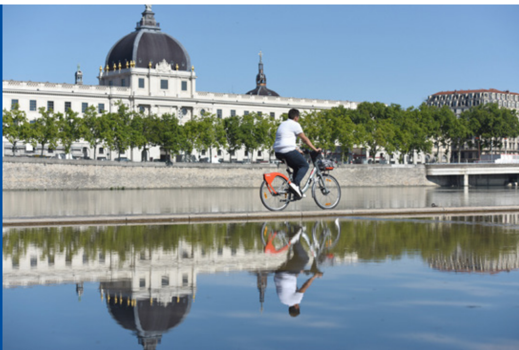
Vue du Rhône et de L'Hotel Dieu à Lyon

Raconter l'histoire du Rhône et de la Saône permet de sensibiliser les enfants et les adultes aux risques d'inondation, aux besoins d'aménagement, à leurs répercussions sur la faune et la flore, aux problèmes de ressource en énergie et en eau... Un moyen ludique de percevoir l'importance d'une relation humaine-nature à améliorer au sein de la ville.