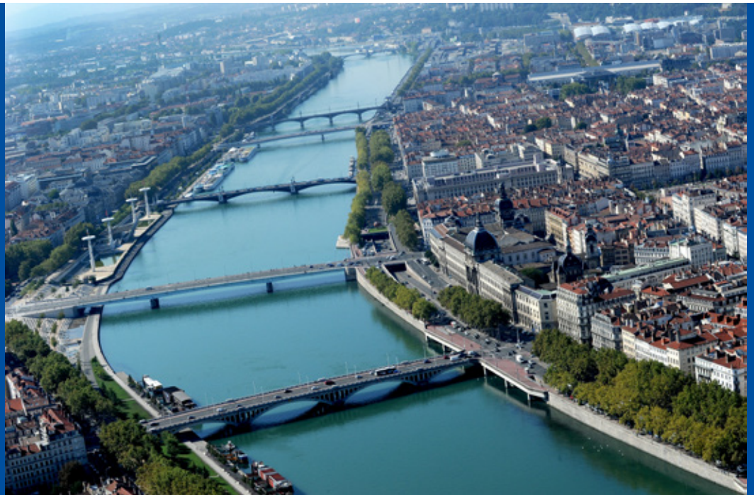
Vue du Rhône à Lyon