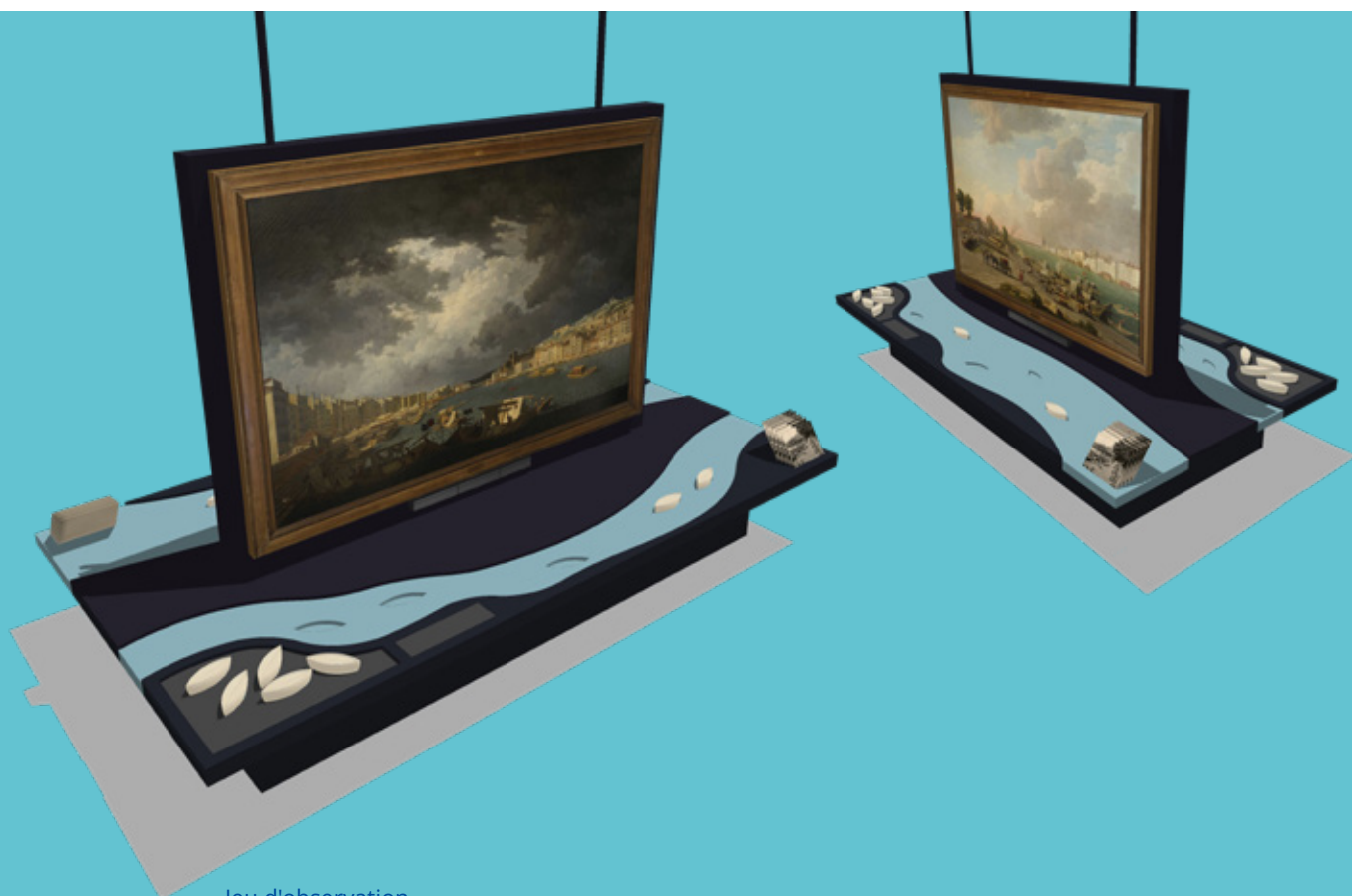
Jeu d'observation Images : Scenorama

Au fil des siècles, Lyon vit au plus près de ses cours d'eau : pêcher, transporter, nager, laver, jouer, se détendre... tant d'usages sont possibles. La rivière et le fleuve favorisent échanges et prospérité.