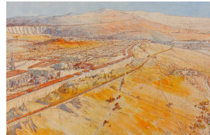
Cité industrielle- Tony Garnier