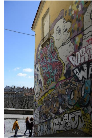
Pentes de la Croix-Rousse