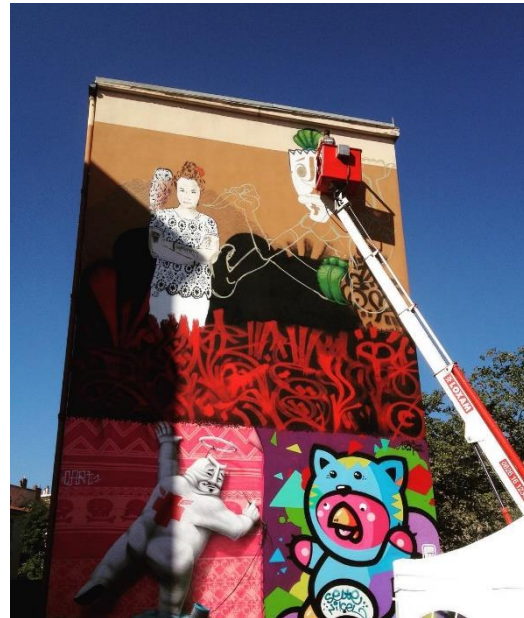
Mur 69 - Croix-Rousse

Diaporama de restitution du projet Patrimoine et moi 2019 2020 ( J Aucagne - C Marsault)