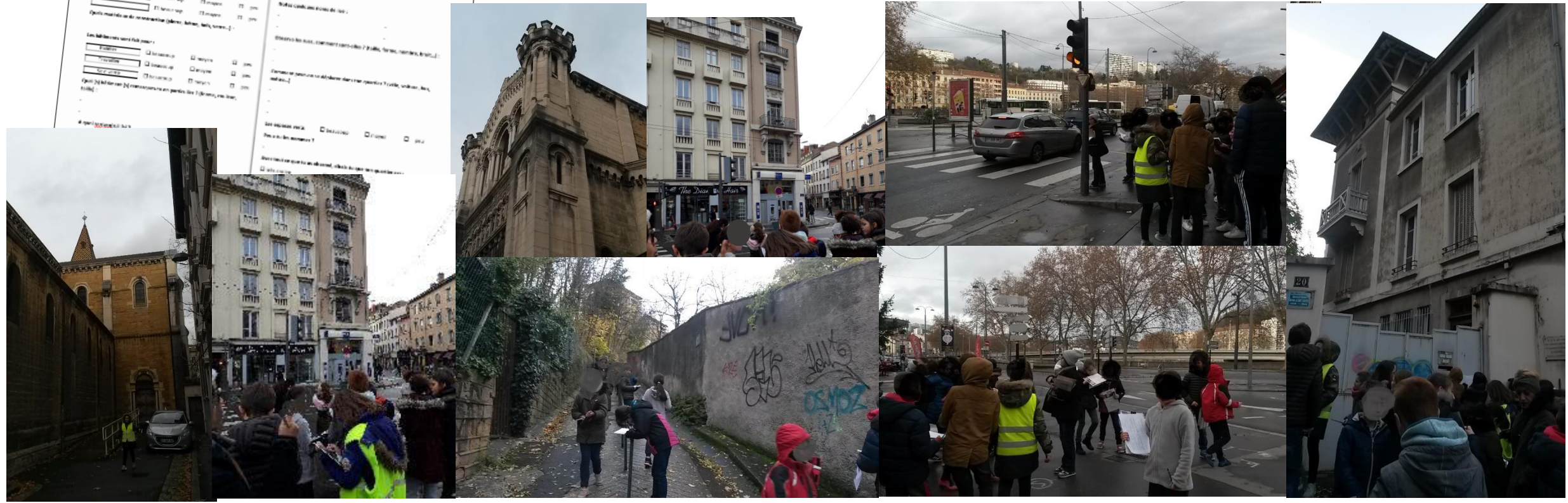
Diaporama de restitution du projet Patrimoine et moi 2019 2020

Le 9 décembre 2019 : « A la découverte du patrimoine de mon quartier »